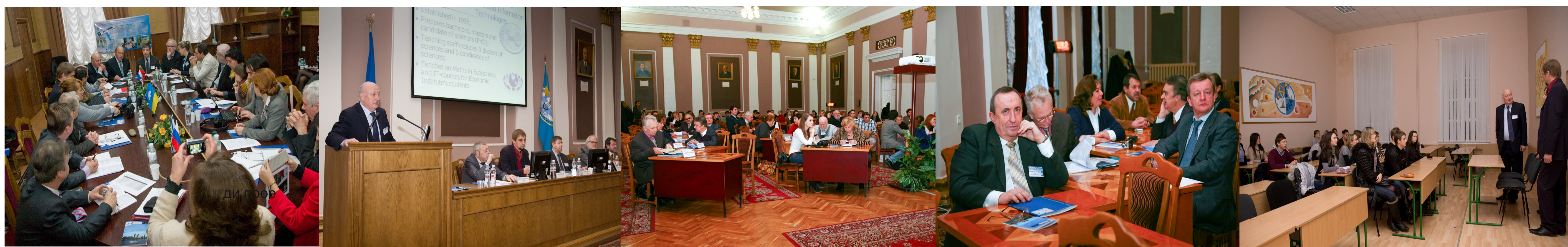
Стартова конференція TEMPUS в НГУ. Прес-конференція. Семінар-тренінг: розробка нових та удосконалення існуючих навчальних планів. Зустріч команди проекту зі студентами НГУ