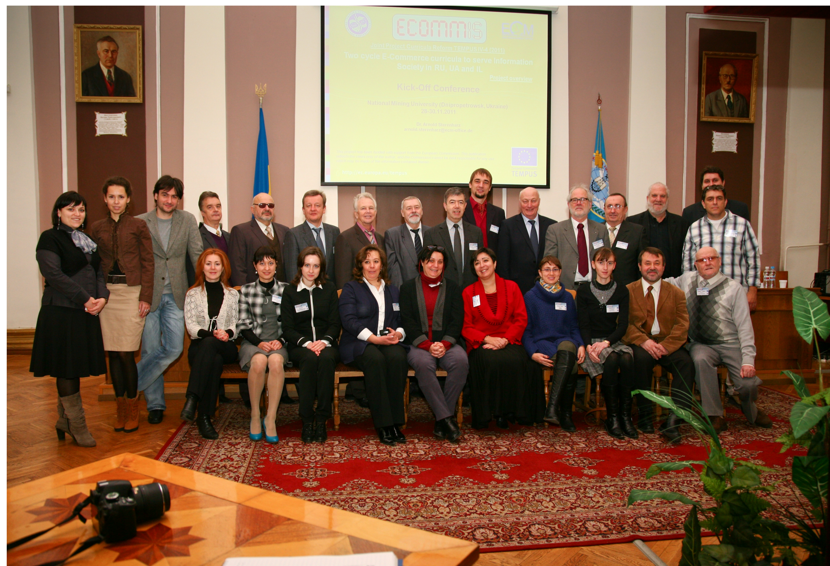
Члени Консорціуму та робоча група проекту від НГУ

Програма Темпус – освітня програма Європейського Союзу, яка підтримує модернізацію системи вищої освіти та сприяє співпраці країн-партнерів ЄС. Програма фінансує міжуніверситетське співробітництво у сфері розробки та вдосконалення навчальних програм, управління університетами, взаємодії працівників сфери науки і громадянського суспільства, партнерства науки і бізнесу та структурні реформи у сфері вищої освіти